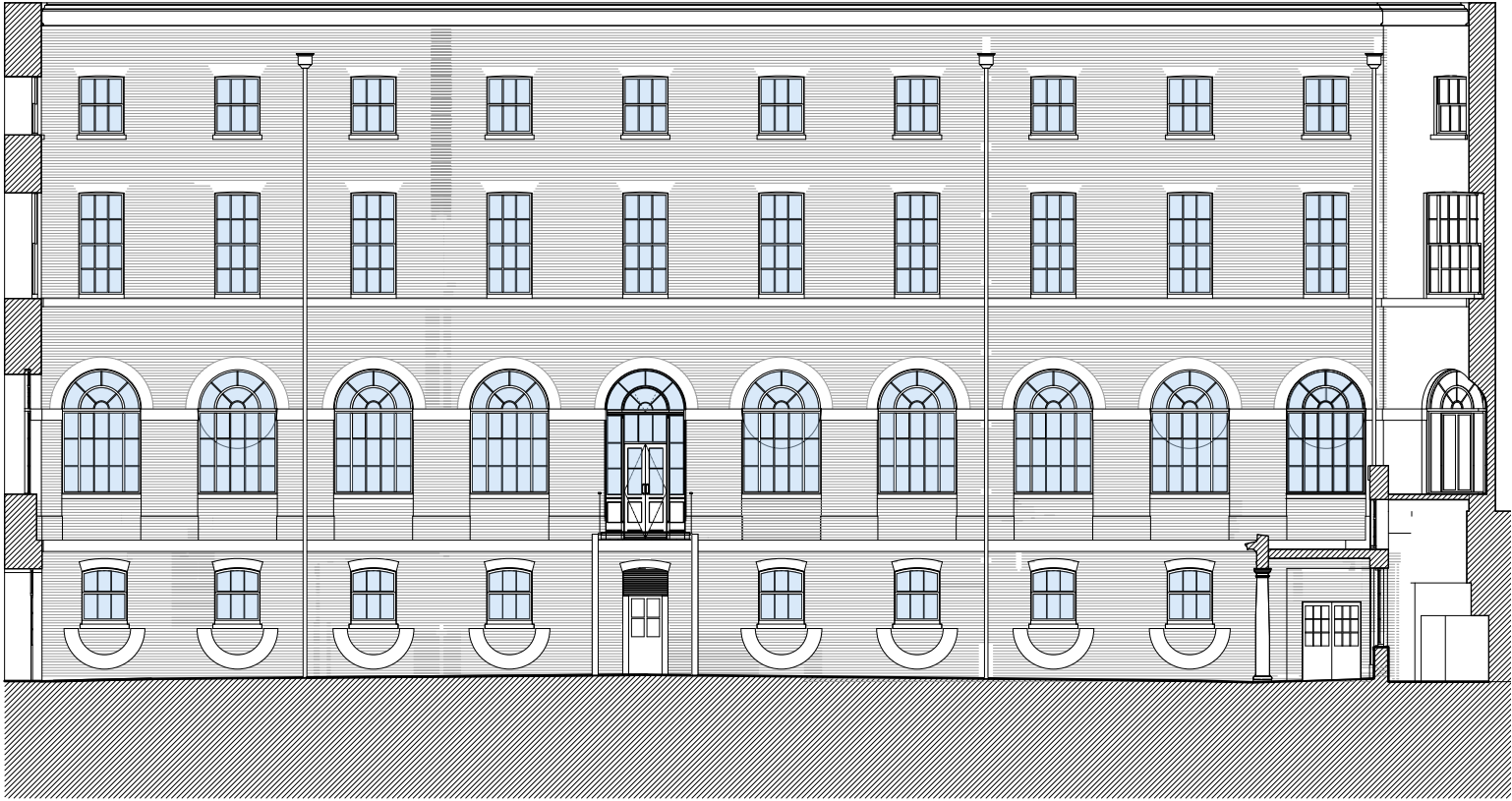
Sectional Elevation B 1:100 @ A1