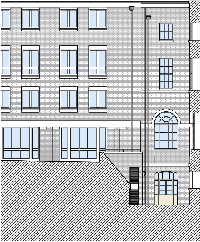
Sectional Elevation A 1:100 @ A1