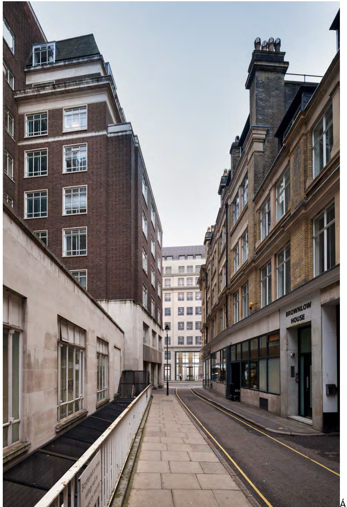
View 4: Brownlow Street