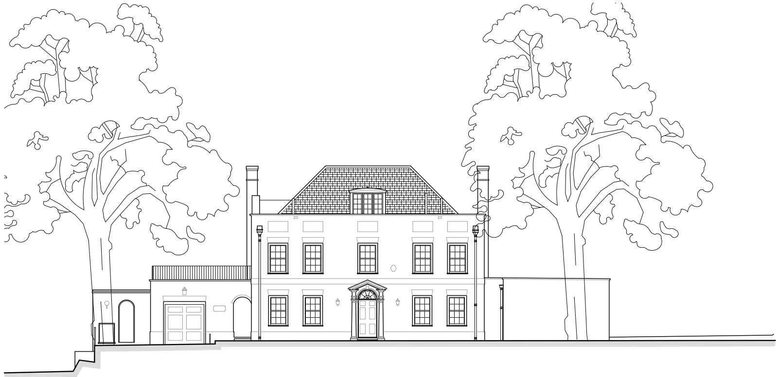
NORTH ELEVATION 1 SCALE 1:200 @ A3 FRG-X-300