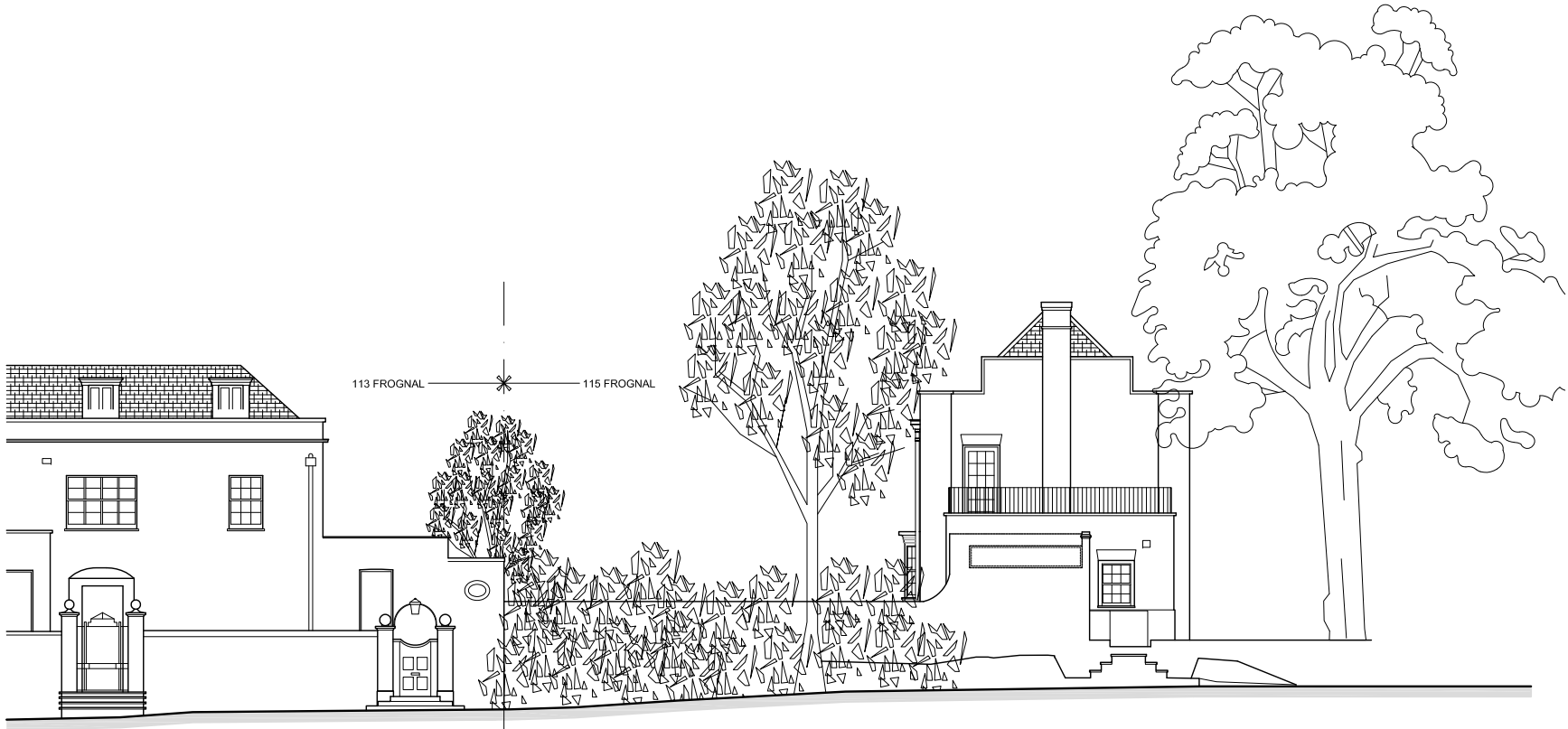
EAST ELEVATION 2 SCALE 1:200 @ A3 FRG-X-300