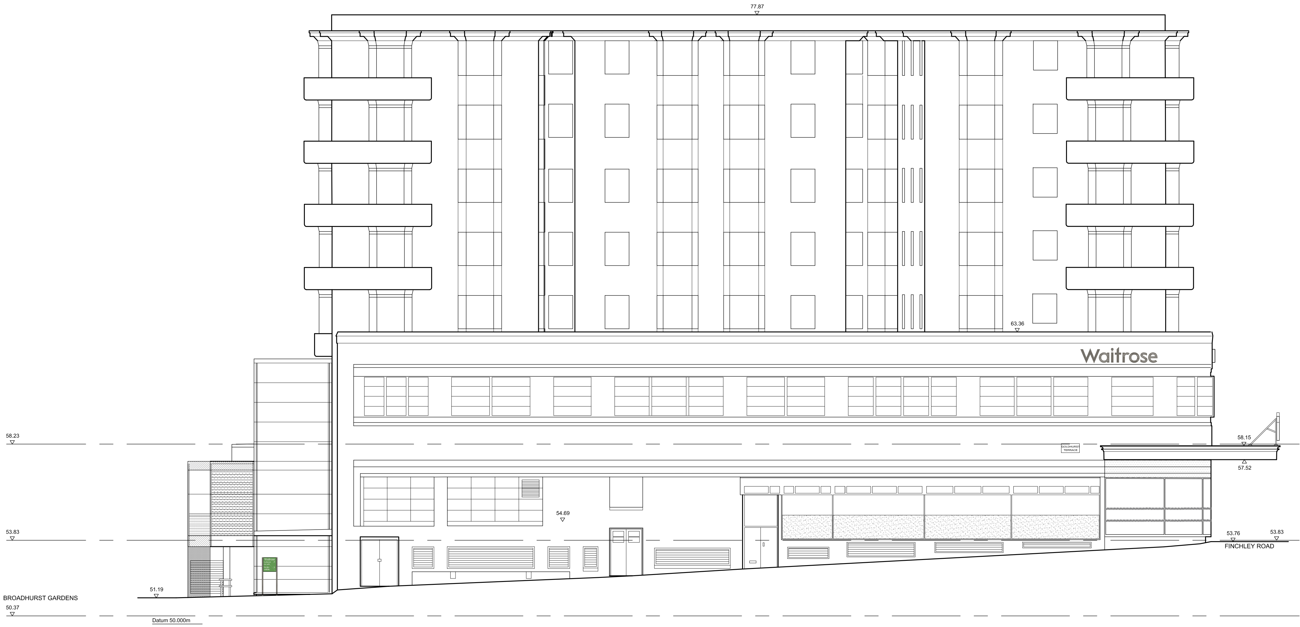
EXISTING SOUTH ELEVATION TO GOLDHURST TERRACE