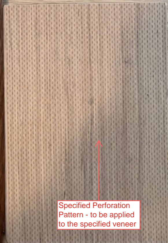
Specified Perforation Pattern - to be applied to the specified veneer